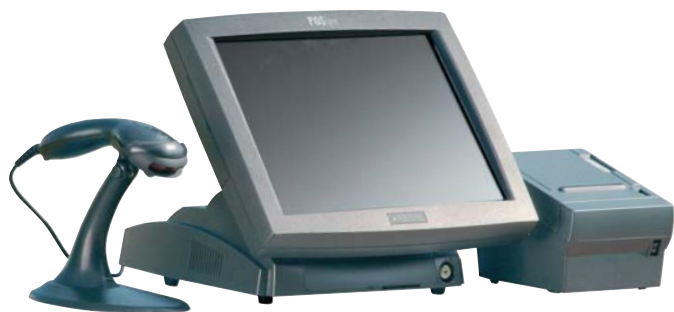
POSline PACK avec TRP-100